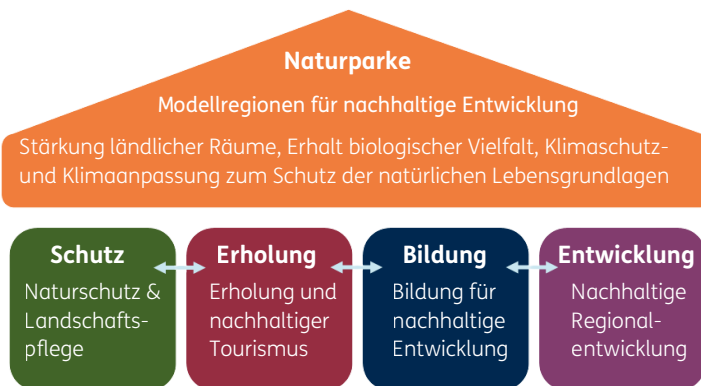
Wartburger Programm der Naturparke in Deutschland

Als älteste und häufigste Großschutzgebietskategorie in Deutschland sind Naturparke im § 27 des Bundesnaturschutzgesetzes und im § 20 des Niedersächsischen Naturschutzgesetzes verankert. Daraus leiten sich unsere Aufgabenbereiche ab, die integrativ betrachtet und bearbeitet werden.