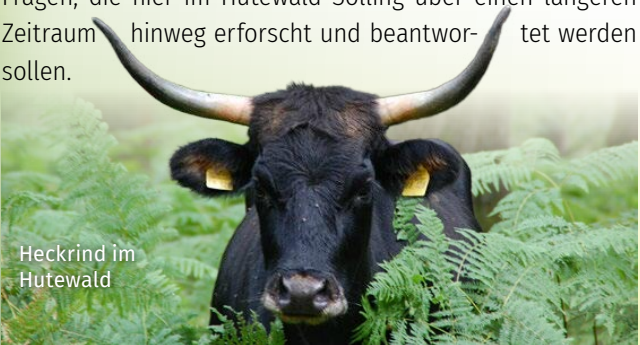
Heckrind im Hutewald

Der Verbiss junger Bäume durch die großen Weidetiere führt zu einer Auflichtung des Waldes. Davon profitieren licht- und wärmebedürftige Tier- und Pflanzenarten. Längerfristig vernetzen sich unterschiedliche Lebensräume wie der Wald und das Offenland. Wie wirkt sich die Beweidung auf die Wälder aus oder wie gut eignen sich die Heckrinder sowie die Exmoorponys für die Waldbeweidung? Das sind spannende Fragen, die hier im Hutewald Solling über einen längeren Zeitraum hinweg erforscht und beantwortet werden sollen.