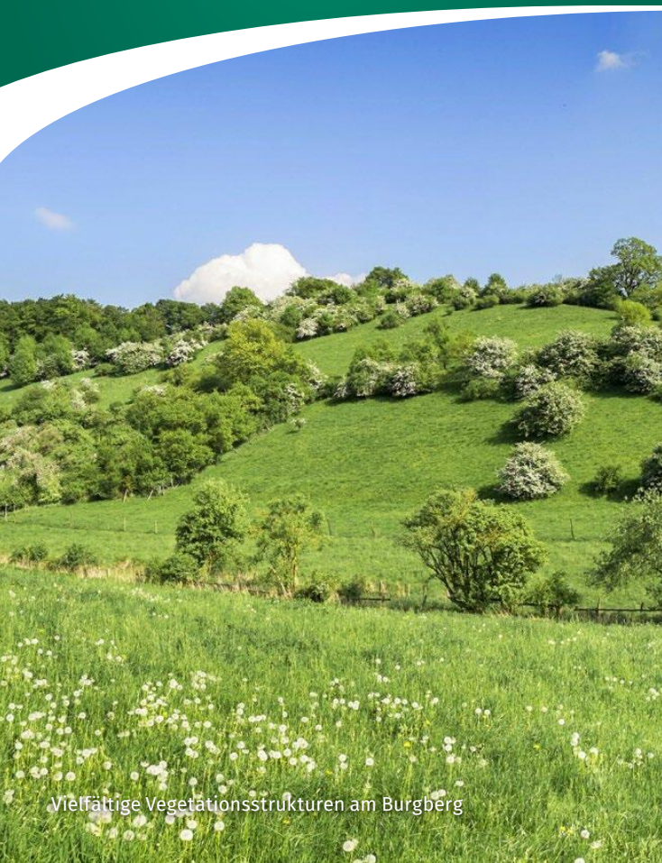
Vielfältige Vegetationsstrukturen am Burgberg

Weidetiere beeinflussen seit der letzten Eiszeit die Entstehung der Landschaft. Durch ihr Fressverhalten sind offene baumfreie Flächen innerhalb der Wälder entstanden.