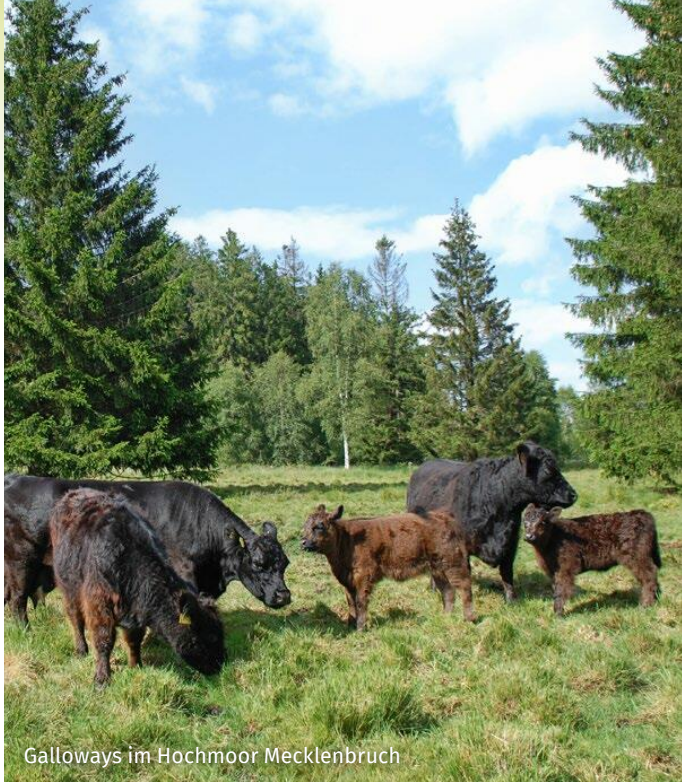
Galloways im Hochmoor Mecklenbruch

Schafe und Ziegen werden zur Pflege trockener und mit Gehölzen bestandener Magerrasen eingesetzt. An den oftmals steileren Standorten verursachen sie zudem weniger starke Trittschäden. Alle vierbeinigen Landschaftspfleger zusammen sorgen im Naturpark für die Pflege und den Erhalt einer traditionellen Mittelgebirgsregion.