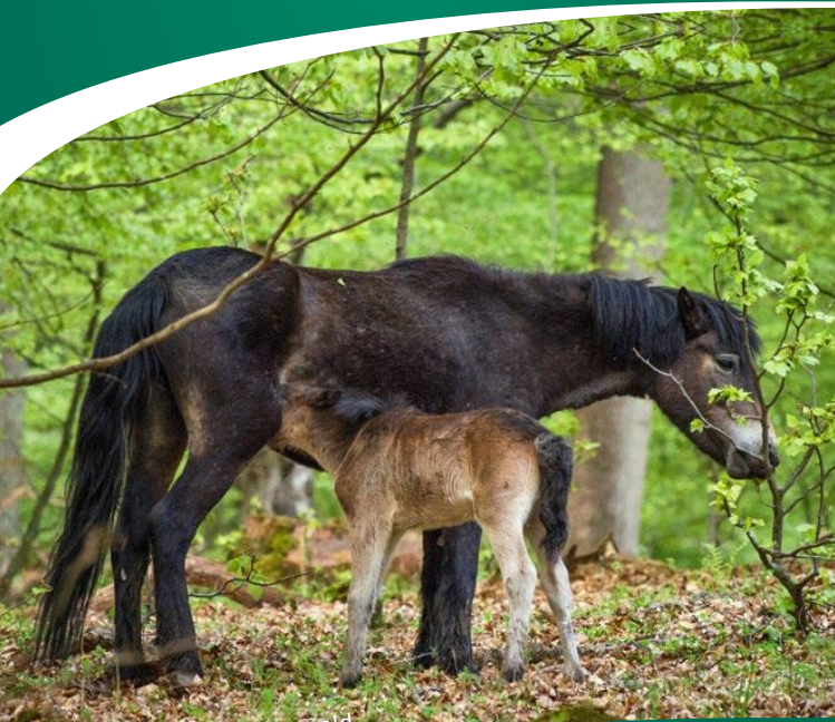
Exmoorponys im Hutewald

In unserem Naturpark könnt Ihr an einigen Standorten urige Heckrinder, Gallowayrinder und ebenso Exmoorponys beobachten. Dazu könnt Ihr verschiedenen, bestens beschilderten sowie markierten Touren unserer Wanderregion folgen. Besonders empfehlenswert ist eine Wanderung auf der „Lebensraumroute Hutewald“ bei Nienover, wo Ihr mit etwas Glück die Tiere aus nächster Nähe beobachten könnt.