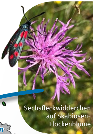
Sechsfleckwidderchen auf Skabiosen- Flockenblume

Auf der Weper (FFH 132) und anderen Kalkmagerrasen entwickeln wir Konzepte für eine insektenverträgliche (Schaf-) Beweidung und begleiten deren Umsetzung.