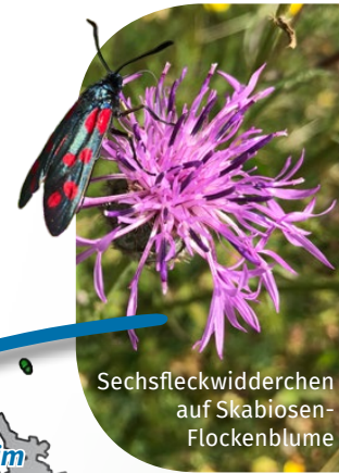
Sechsfleckwiderchen auf Skabiosen-Flockenblume

Auf der Weper (FFH 132) und anderen Kalkmagerrasen entwickeln wir Konzepte für eine insektenverträgliche (Schaf-) Beweidung und begleiten deren Umsetzung.