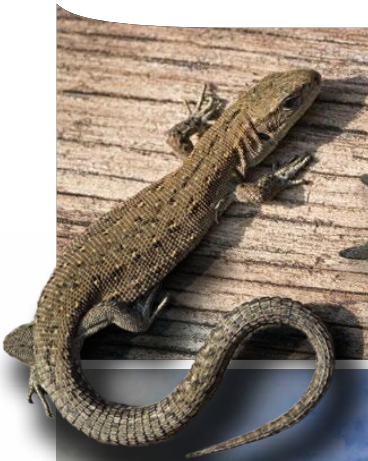
Waldidechse und Moosjungfer