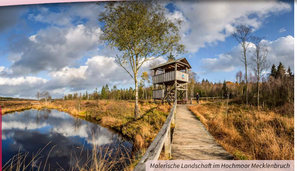
Malerische Landschaft im Hochmoor Mecklenbruch

Die Hitze des Sommers ist vorüber, die Natur bereitet sich auf den bevorstehenden Winter vor: Die Wälder färben sich spektakulär bunt, die Tiere sammeln ihre Vorräte. Und auch wir werden zu fleißigen Sammlern. Die Äpfel, Zwetschgen und Nüsse werden geerntet und der Wald ist in diesem Jahr voller Pilze.