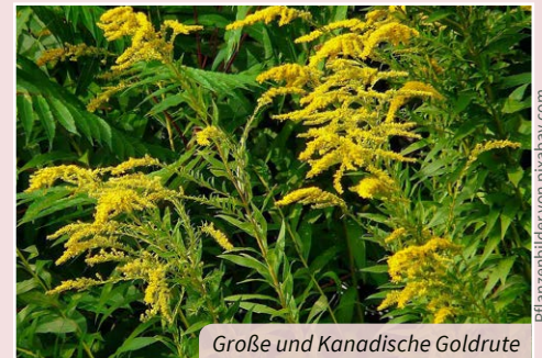
Große und Kanadische Goldrute