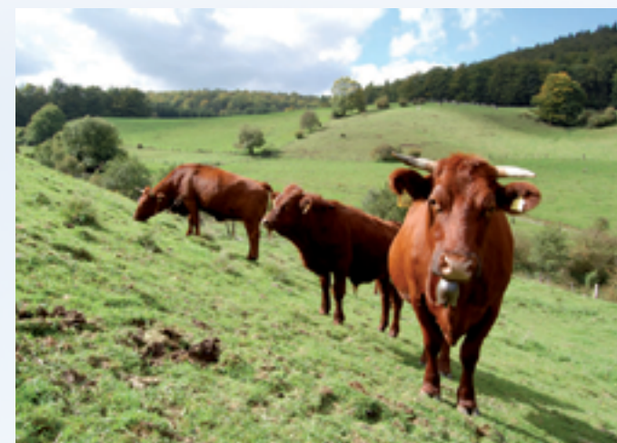
Rotes Höhenvieh im Hellental