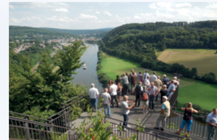
Aussicht vom Skywalk bei Bad Karlshafen