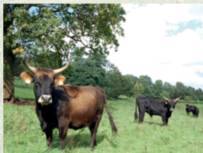
Auerochsen bei Derental

Nähere Informationen hierzu in dem Faltblatt „Weidetiere“.