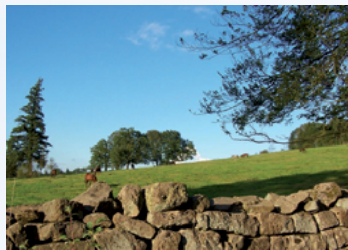
Historische Sandsteinmauern in Neuhaus